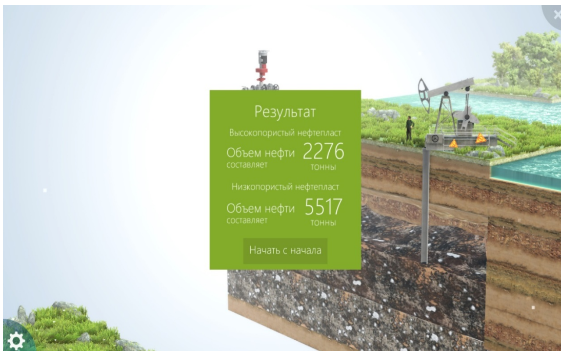
Рисунок 3 – Итоговые результаты количества откочанной нефти из различно-проницаемых каналов фильтрации

В программной среде “UnityPro”, выполнена визуальная откочка нефти, из двух проницаемых каналов фильтрации. От высокопористого и низкопористого каналы фильтрации после каждой откочки нефти выводится таблица откочанной нефти каждого слоя. В самом конце, выводится на экран общий итоговый результат откочанной от обоих слоев. Как показано на рисунке 3.