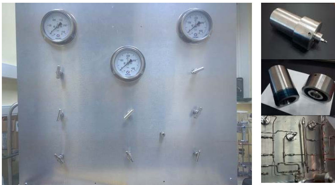
Рисунок – 1 Реактор СКФ

рядом причин: экологическая безопасность, дешевизна и доступность. Сушка в сверхкритических флюидах используется для получения аэрогелей, мезопористого кварцевого стекла, оптического кварцевого стекла.